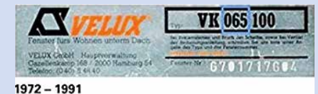
Bild 5/6: Dachflächenfenster, z. B. von Velux Baujahr bis 1991 mit z. B. diesen Typenschildern