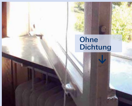
Bild 2/3: Fenster mit Isolierglas, ohne Dichtung (typisches Merkmal Hebelfunktion mit Gestänge)

Nicht gefördert werden Kunststoff- oder Holzfenster mit Isolierglas, mit mindestens 1 umlaufenden Dichtung (das Alter des Fensters ist unerheblich).