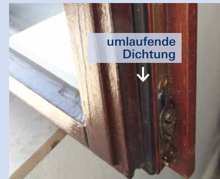
Holz- oder Kunststofffenster mit Isolierglas, mit mindestens einer umlaufenden Dichtung