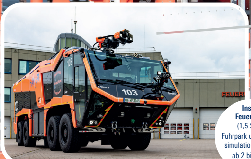
Inside Feuerwehr (1,5 Std.): Fuhrpark und Brand- simulationsanlage ab 2 bis max. 5 Personen

Verpasse nicht das komplette Repertoire des Flughafens : Nach der Vorführung der Modellschau geht's auf die Vorfelder , um den Abfertigern über die Schulter zu schauen und zur Werkfeuerwehr mit ihren zahlreichen unterschiedlichen Einsatzgebieten. Staune nicht schlecht über die imposanten Löschfahrzeuge wie zum Beispiel den schwergewichtigen Z8.