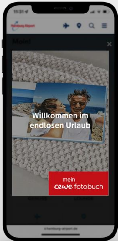
Werbe Pos. 1

Beispiele (Muster / Änderungen und Abweichungen möglich)