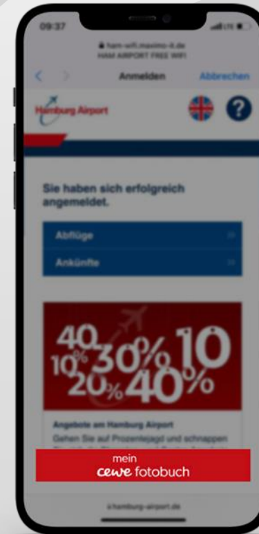
Werbe Pos. 3

HAM Landing-Page Sticky Banner der nach dem Log-in, sowie bei Abruf von Informationen zum Gate oder den Abflugzeiten erscheint (statisch inkl. Link zu Ihrem Online-Auftritt)