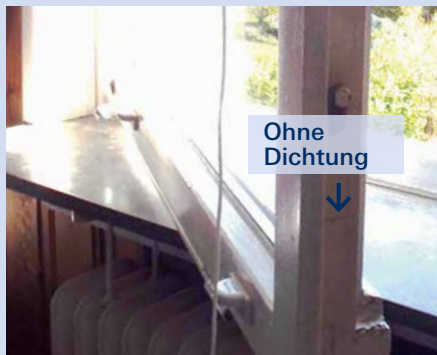
Bild 2/3: Fenster mit Isolierglas, ohne Dichtung (typisches Merkmal Hebelfunktion mit Gestänge)