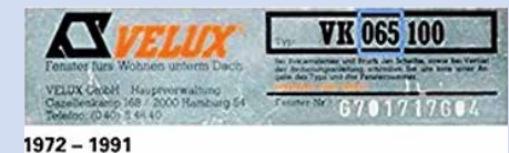
Bild 5/6: Dachflächenfenster, z. B. von Velux Baujahr bis 1991 mit z. B. diesen Typenschildern